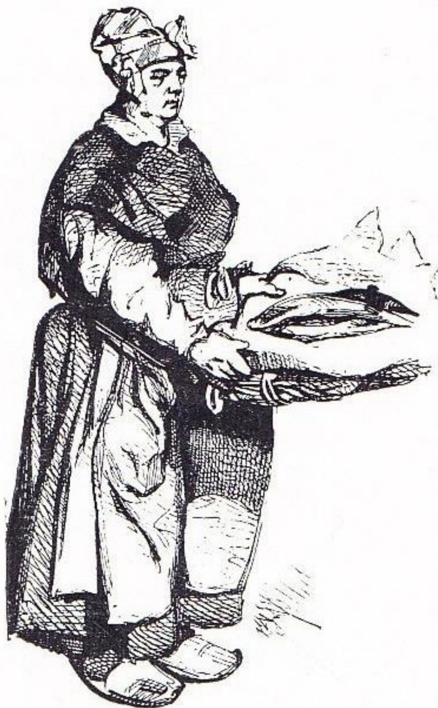
LES MÉTIERS DE PARIS. La marchande de poisson D'après un dessin d'HENRY MONNIER.